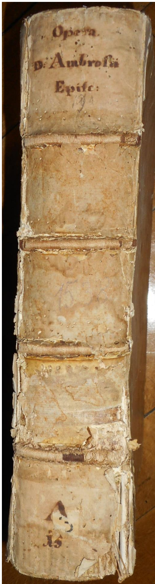
Dorso del tomo 1 con i tasselli del fondo librario dei minori di Orselina, cop. CCLA, 20160509